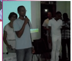
JPA Témoignage de l'assemblée