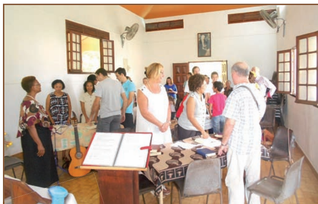
Culte brunch le dimanche 8 mars