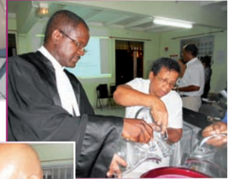
Symbole de l'eau, signe d'accueil et d'unité