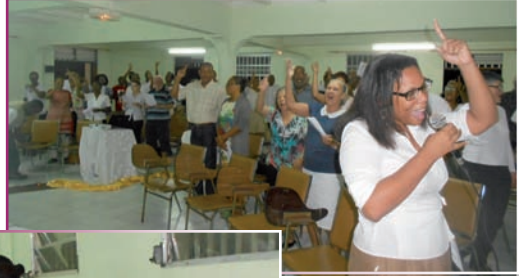
Chorale de la communauté du Chemin neuf

L'œcuménisme est en marche ! Le dialogue interreligieux lui emboîte le pas ! Prions que ce n'est pas seulement pour réagir à l'actualité mais véritablement pour établir un dialogue qui favorise la connaissance mutuelle et le vivre ensemble que nous poursuivrons nos échanges et nos rencontres.